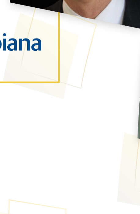
Robert Engle Premio Nobel de Economía