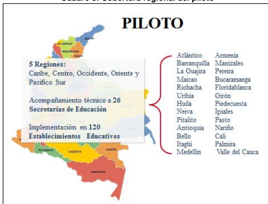
Cuadro 3: Cobertura regional del piloto