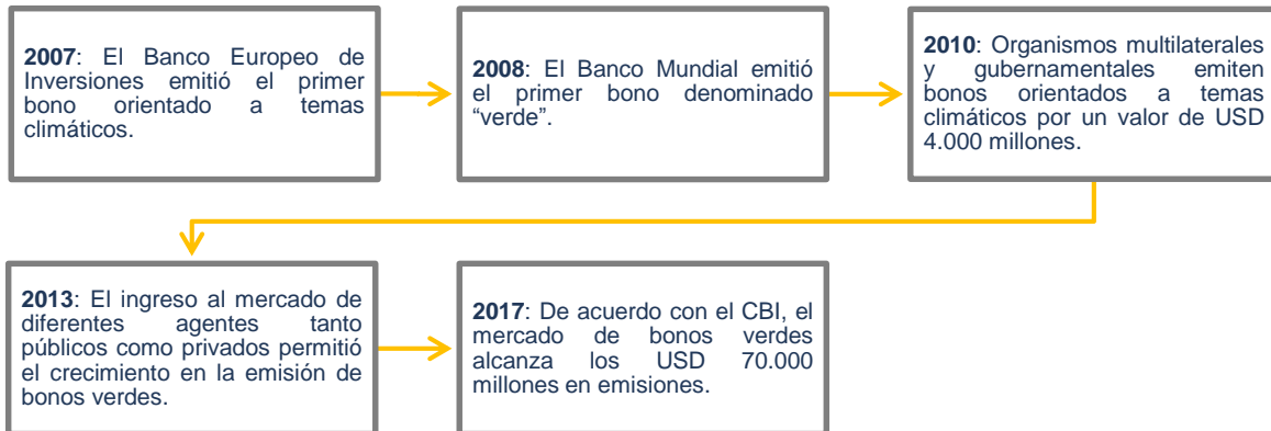
Cuadro 2. Evolución del mercado de bonos verdes